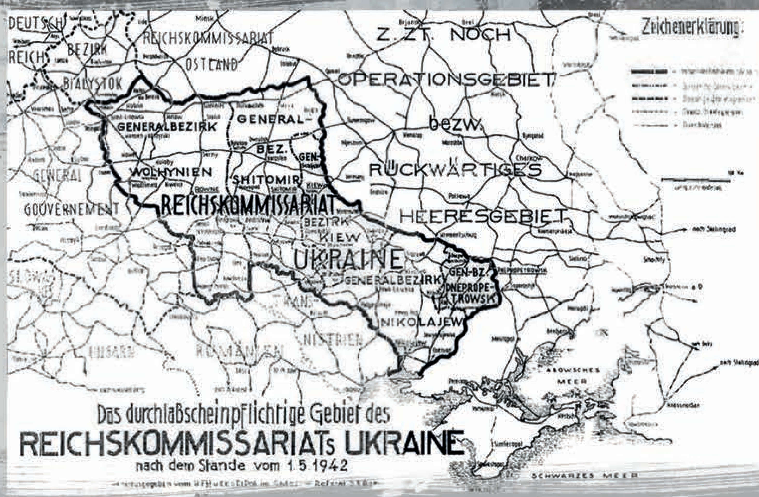
Карта райхскомісаріату «Україна» станом на 1 травня 1942 р. На схід від РКУ – області України під управлінням воєнної адміністрації. На захід – Польське Генерал-губернаторство включно з дистриктом «Галичина». На південь – губернаторство Трансністрія.

Заходи в «циганському питанні» розрізнялися залежно від домінування тієї або іншої гілки окупаційної влади: органів цивільної влади, структур СС-поліції або Вермахту. Одночасний вплив багатьох чинників та ініціатив різних рівнів робили «циганську» політику непослідовною й інколи суперечливою. У зв'язку з браком інструкцій від центральних органів (з Берліну) та розмаїттям локальних обставин, що супроводжували окупаційну політику на місцях, розв'язання «циганського питання» в різних зонах окупованої України мало свої особливості.