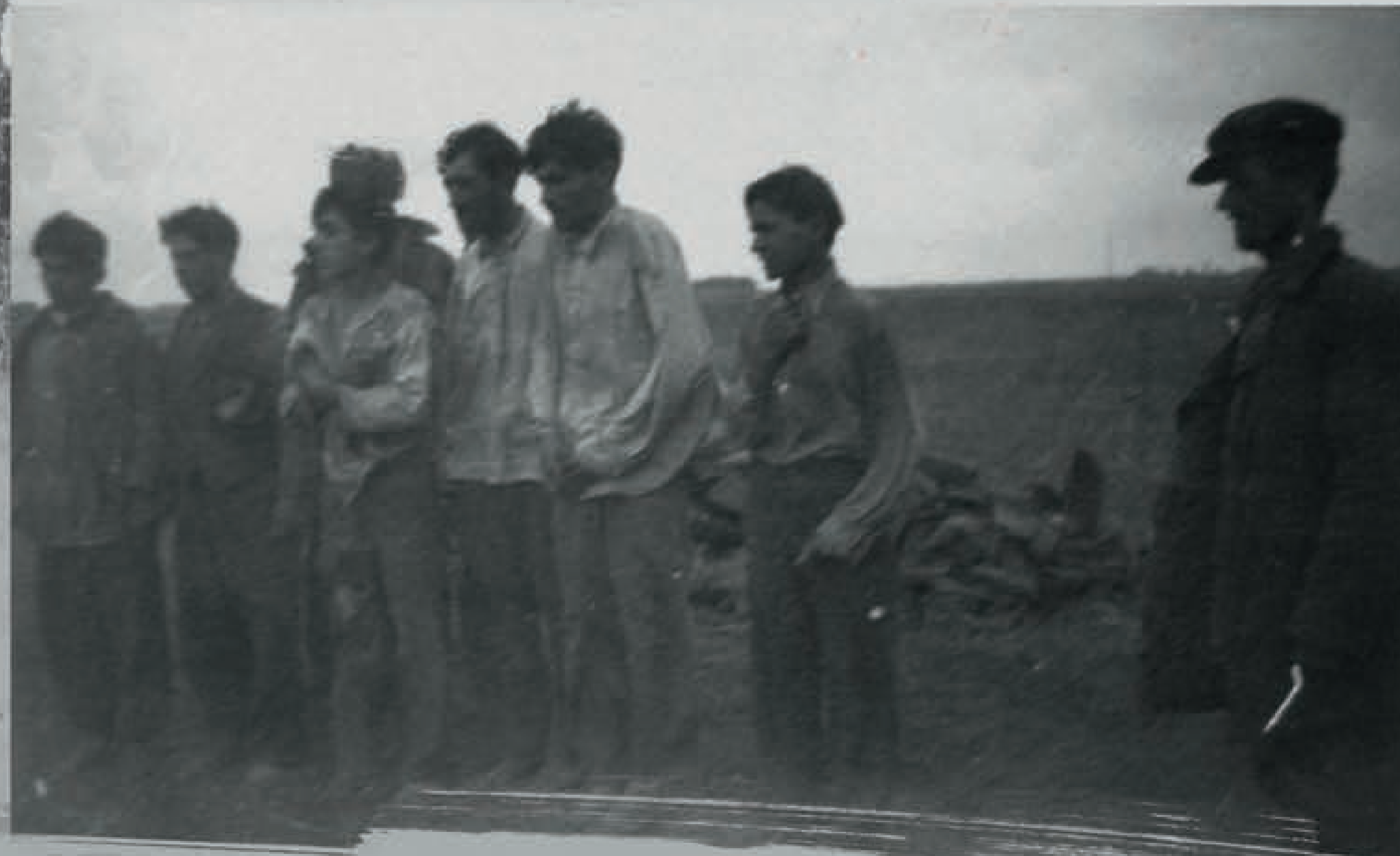
Фотокартка з групою ромських чоловіків перед розстрілом, ймовірно – Україна. Напис на звороті: «Цыгане перед расстрелом осенью 1942 г.». Це фото було, серед інших, передано до Надзвичайної державної комісії зі встановлення злочинів німецько-фашистських загарбників у 1944 р. як трофейне, що було захоплено у німців.